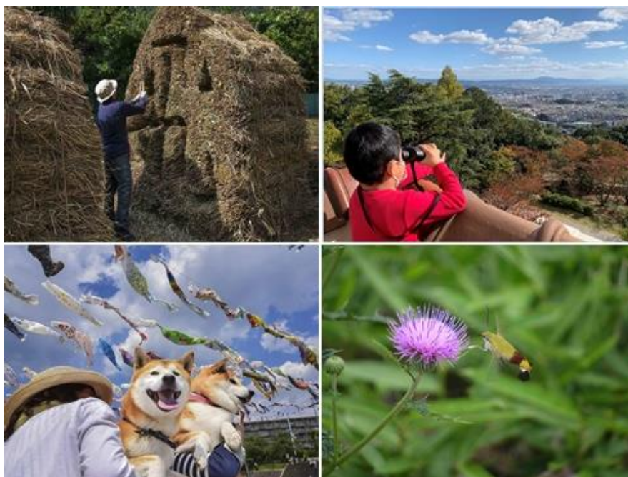
第2回コンテスト受賞作品（一部）

阿武山観測所や阿武山周辺を含む北摂地域で撮影された四季折々の写真を募集します。応募いただいた作品は主催者のWebサイト上に公開します。厳正な審査の結果入賞された作品は、賞品を贈呈すると共に、当NPOが出版する冊子などに掲載いたします。裏面の応募方法をご覧ください、ふるってご応募ください。